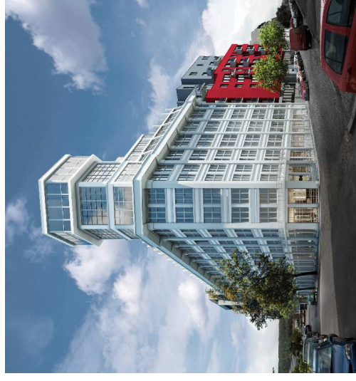
LIBERTY BUILDING II. ETAPA