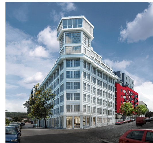
LIBERTY BUILDING II. ETAPA

www.geosan-development.cz www.libertybuilding.cz