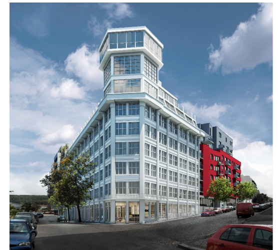
LIBERTY BUILDING II. ETAPA